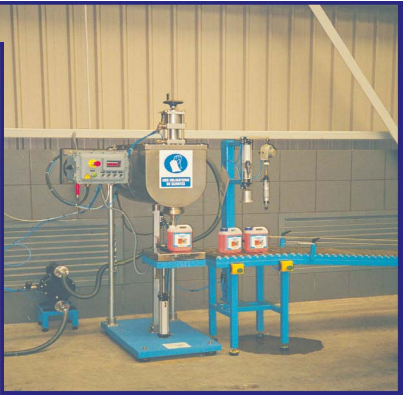
Modèle UVI SG-10 pour bidons avec fermeture à pression de bouchons en forme de pas de vis