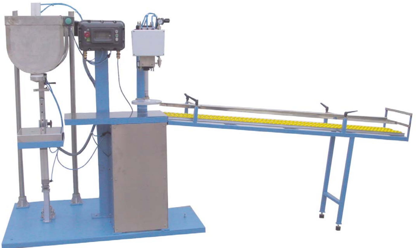
Modèle UVI SG-10 pour boîtes avec fermeture à pression des couvercles