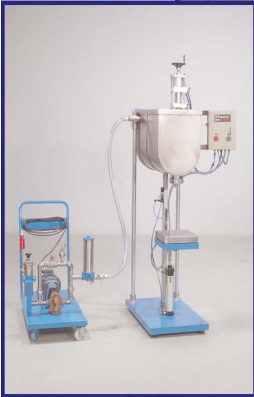
Tremie avec chariot et filtre cuno intégré